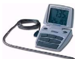
Termometro a sonda

Sono una raffinatezza in cucina. Quello a sonda serve per misurare la temperatura di cottura al cuore ( cioè al centro dell'arrosto, del pesce,... ) basta infilarlo ( può anche essere lasciato per tutta la cottura, perché il cavo è resistente al calore e fa anche da timer sonoro quando si raggiunge la temperatura voluta ). Quello da forno, va messo direttamente nel forno e segna l' esatta temperatura raggiunta dal forno.