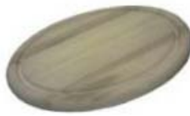
Taglieri in legno (almeno 6)