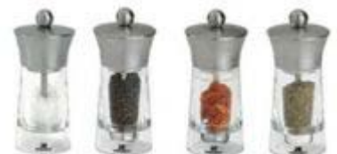
Macina sale, pepe, peperoncino e erbe aromatiche secche (timo, ...)