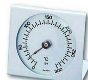
Termometro da forno

Sono una raffinatezza in cucina. Quello a sonda serve per misurare la temperatura di cottura al cuore ( cioè al centro dell'arrosto, del pesce,... ) basta infilarlo ( può anche essere lasciato per tutta la cottura, perché il cavo è resistente al calore e fa anche da timer sonoro quando si raggiunge la temperatura voluta ). Quello da forno, va messo direttamente nel forno e segna l' esatta temperatura raggiunta dal forno.