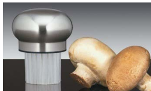
Spazzolino pulisci funghi