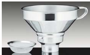
Imbuto acciaio inox