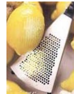
Grattugia per agrumi e zenzero