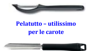
Pelatutto - utilissimo per le carote Coltello svuota zucchine (utilissimo per farle ripiene)