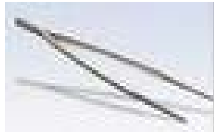
Pinza per girare arrostiti (senza forare con forchetta)