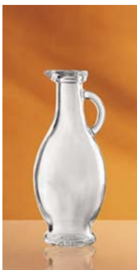
Bot. Anfora Egizia ml 250 Vetriere Bruni