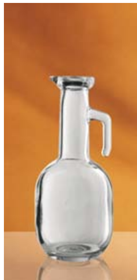
Bot. Sorrento ml 250 Vetriere Bruni