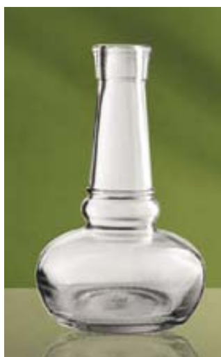
Bot. Aceto Ducale ml 250 Vetriere Bruni