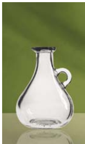
Bot. Anfora Messicana ml 250 Vetriere Bruni